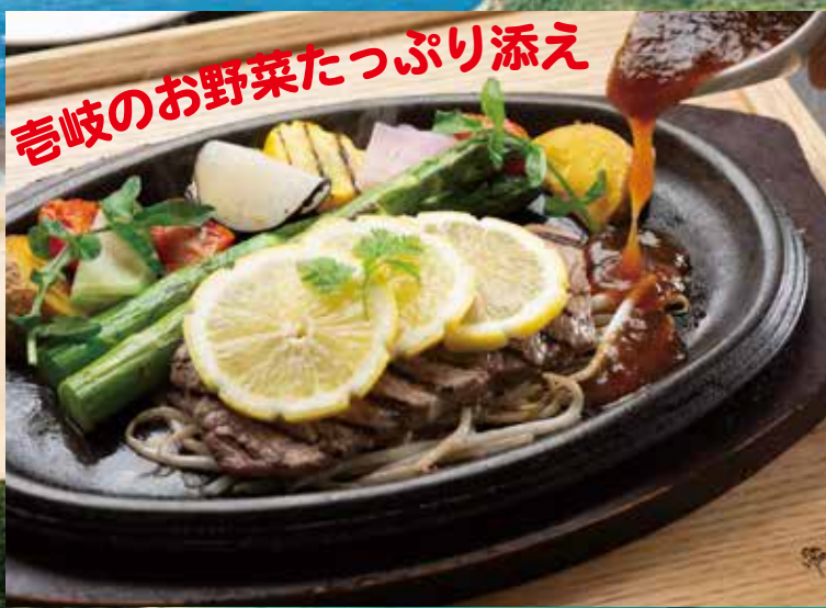
壱岐のお野菜たっぷり添え 『サーロインレモンステーキ』

明治より令和まで、歴史ある特別な場所で 壱岐の特別な素材を使ったお料理を ご堪能いただけます。