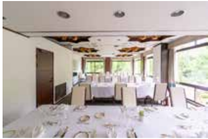
3階全室(蘭・薔薇・藤)